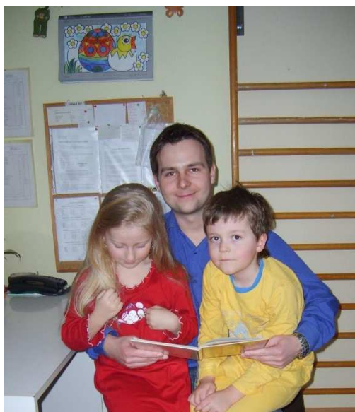
Předškoláci z MŠ Březová