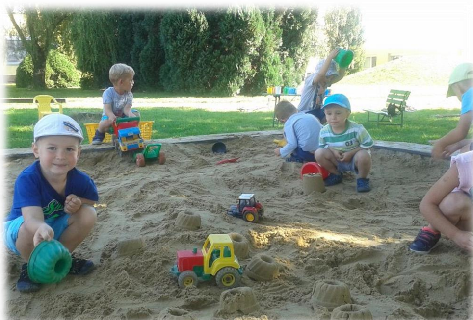
Na pískovišti se nám daří...

A takto jsme zahájili školní rok v mateřské škole: sice s nižším počtem dětí (54) ve třech třídách s pěti pedagogy, ale zato s úsměvem a chutí do práce, což dokumentují přiložené fotografie: