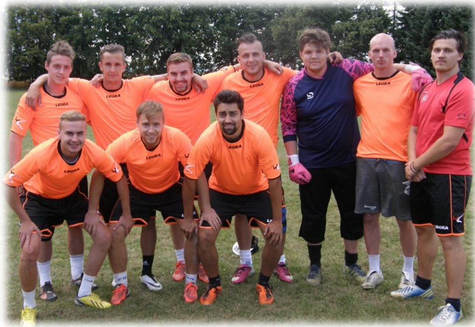
Druhé místo tým „ANI SE NEPTEJ“