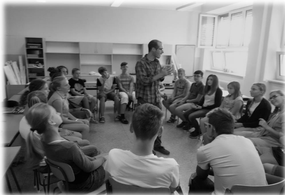
Anglický týden s rodilým mluvčím (novinka šk. roku 2016/2017)