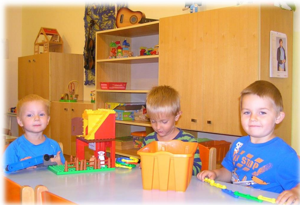
A u stavebnice taky...

Přejeme všem - dětem, žákům, rodičům, ať prožijí hezký školní rok 2016/2017.