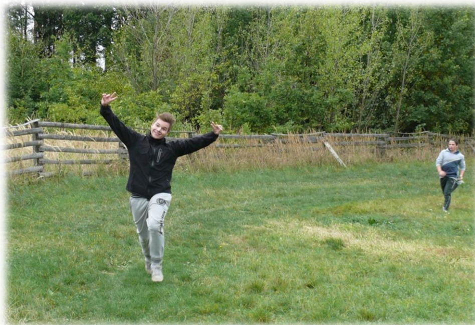
Momentka z tradičního Svatováclavského běhu (školní rok 2015/2016)

A takto jsme zahájili školní rok v mateřské škole: sice s nižším počtem dětí (54) ve třech třídách s pěti pedagogy, ale zato s úsměvem a chutí do práce, což dokumentují přiložené fotografie: