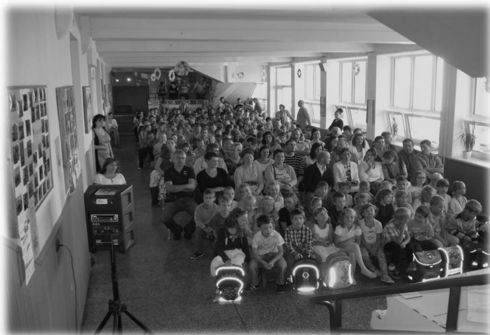
Slavnostní zahájení školního roku 2016/2017 (188 žáků, mezi nimi 18 prvňáčků)

Vážení čtenáři, na počátku září jsme slavnostně přivítali nový školní rok a v následujících dnech jsme se hezky zčerstva pustili do školních činností. V tomto příspěvku však nebudeme naší činnost popisovat, nýbrž fotograficky dokumentovat.