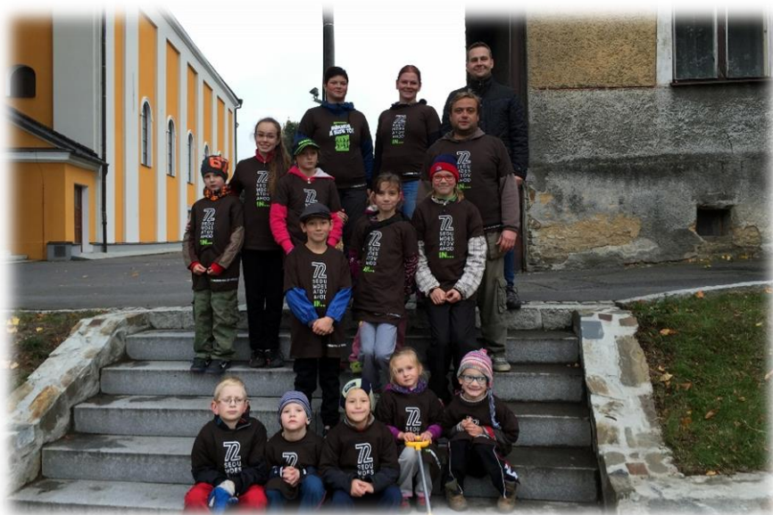
Účastníci projektu 72 hodin

Počasí nám taktéž přálo, a tak jsme si užili krásné odpoledne, protkané dobrou náladou a vůní podzimu. Odcházeli jsme domů s pocitem dobře odvedené práce a příjemně unaveni. Věřím, že se v příštím roce sejdem v ještě větším počtu.