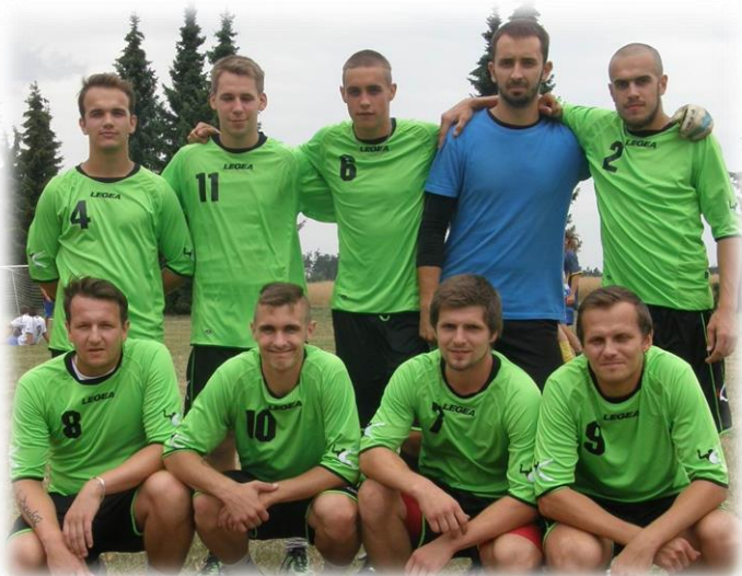
Vítězný domácí tým TJ Jiskra Jančí A

V neděli po turnaji proběhl na hřišti v Jančí tradiční dětský den pořádaný sportovci ve spolupráci s místní mládeží. Zasoutěžit si přišlo na padesát dětí, které plnily různorodé soutěže. Pro děti i dospělé byla pak připravena improvizovaná střelnice, kde si bylo možné vyzkoušet střelbu