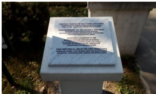
Deska na vojenském hřbitově v Krakově